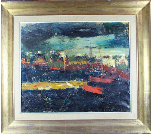
Tableau - "Le meire Anvers"