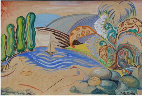
Tableau - "Les Pêcheurs"