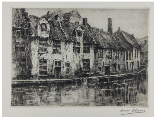
Tableau - "Le maison du cours d'eau"