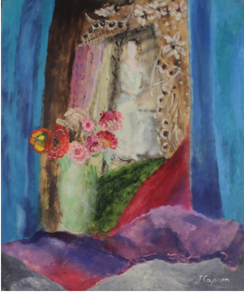
Tableau - "Le bouquet"