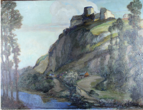
Tableau - "Château Gaillard Petit Andelys"