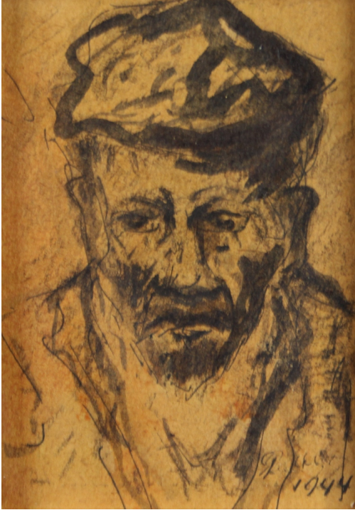
Tableau - "Le paysan"