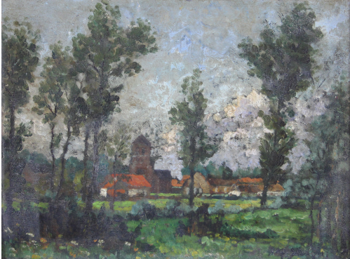
Tableau - "Le village"