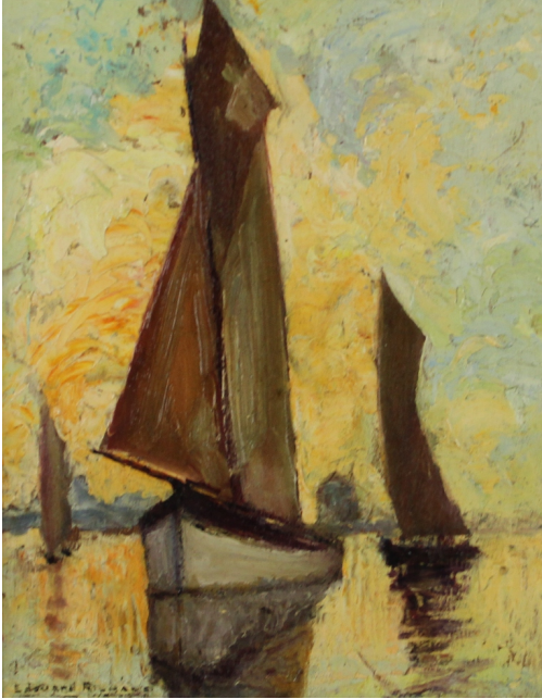
Tableau - "Bateaux en mer"