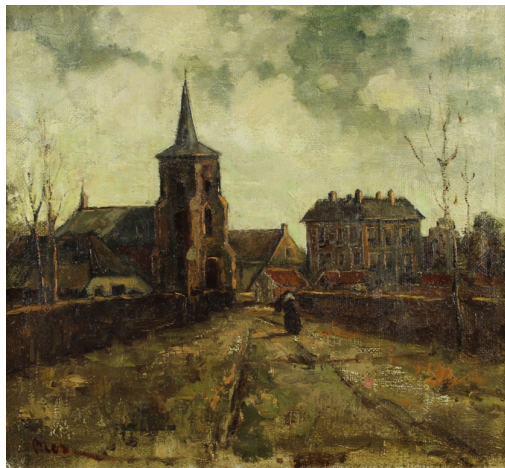
Tableau - "Retour au village"