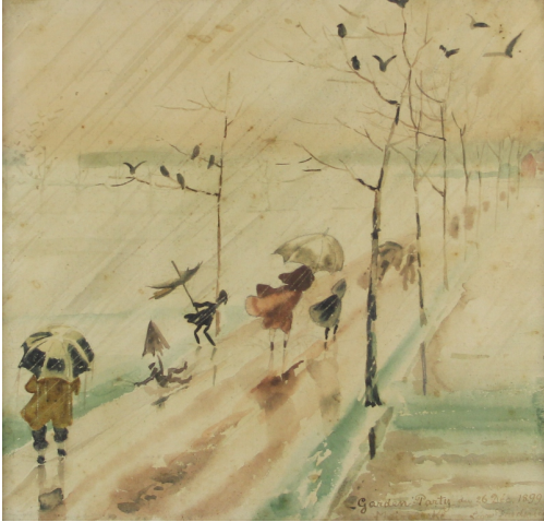
Tableau - "Garden Party Marelbeke"