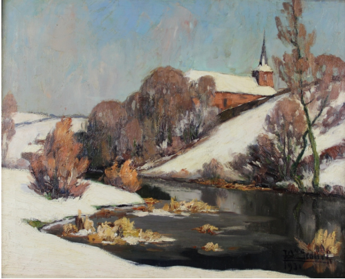
Tableau - "Village sous la neige"