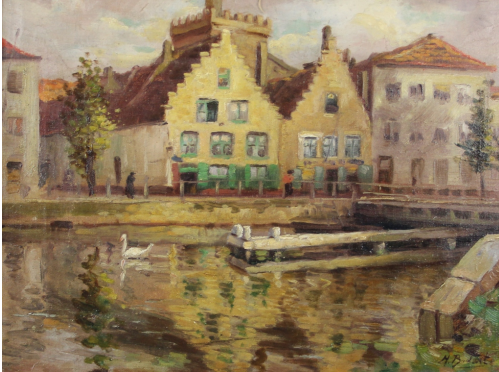
Tableau - "Canal À Gand"