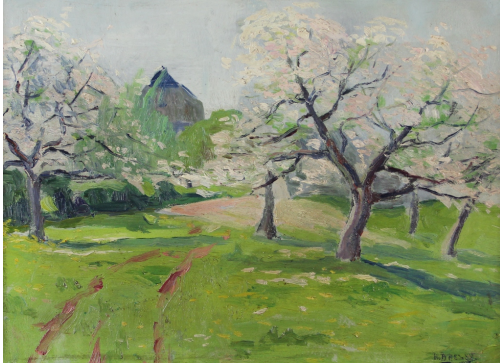
Tableau - "Le printemps"