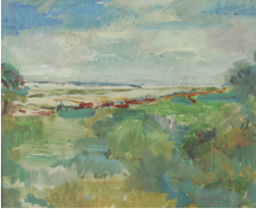
Tableau - "La lagune de Venise"