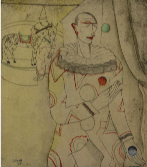
Tableau - "Le cirque"