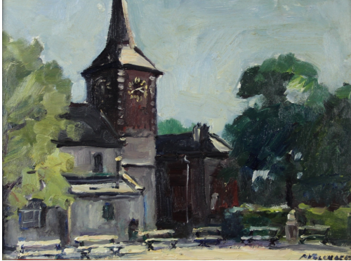
Tableau - "Les bancs devant l'Église"