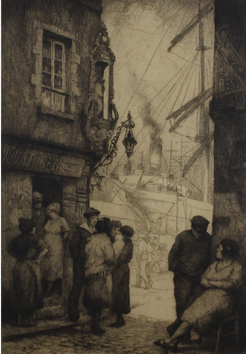
Tableau - "Ruelle au port d'Anvers"