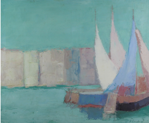
Tableau - "Le voiliers "