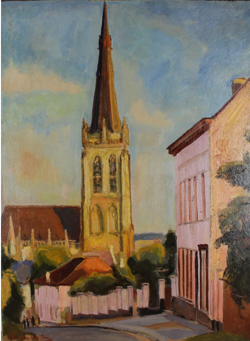
Tableau - "L'Église d'alsemberg"