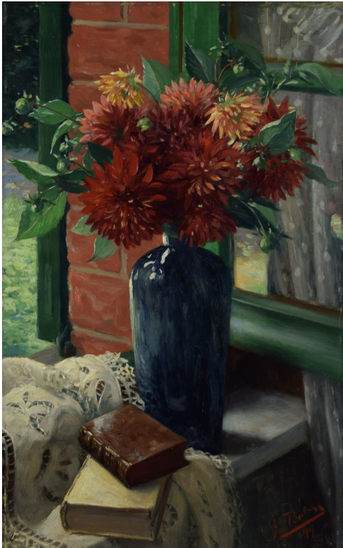
Tableau - "Le coin du salon"