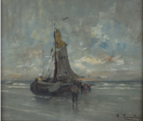
Tableau - "Les pêcheurs"