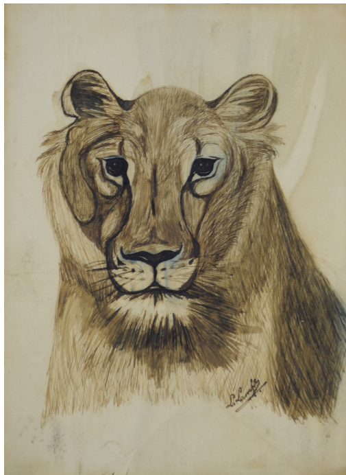
Tableau - "Le lion"