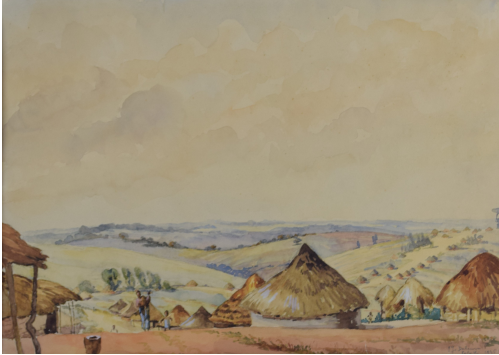
Tableau - "Le village en Afrique "