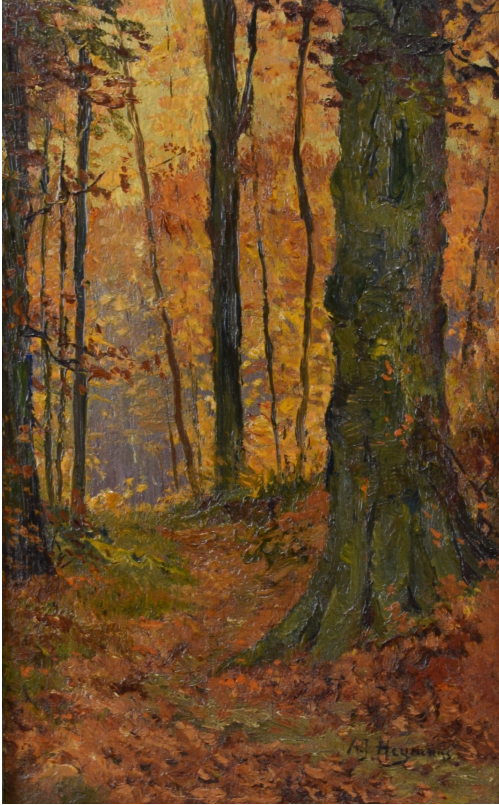
Tableau - "L'automne"