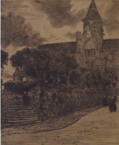
Tableau - "L'horloge"