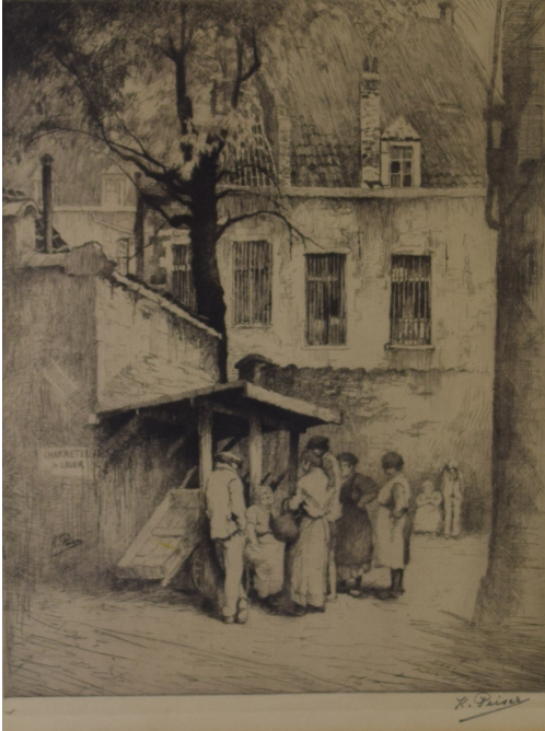
Tableau - "Charettes À louer"