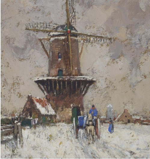
Tableau - "Neige en flandre"