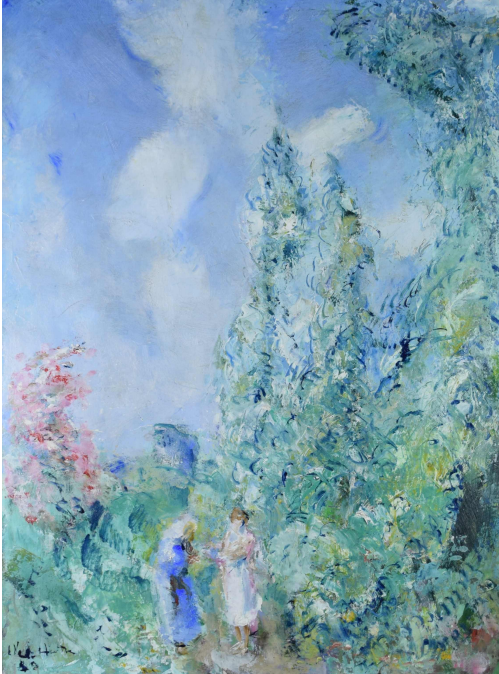
Tableau - "Conversation au jardin"