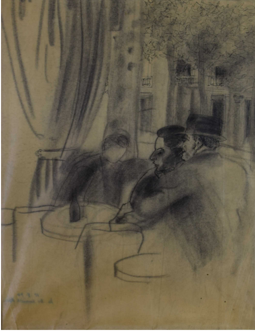
Tableau - "L'apéro"