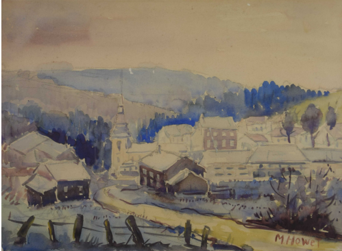
Tableau - "Le village ardennais "