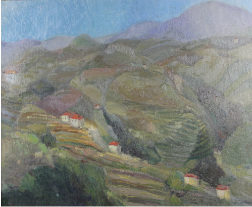
Tableau - "Alpes Maritime"