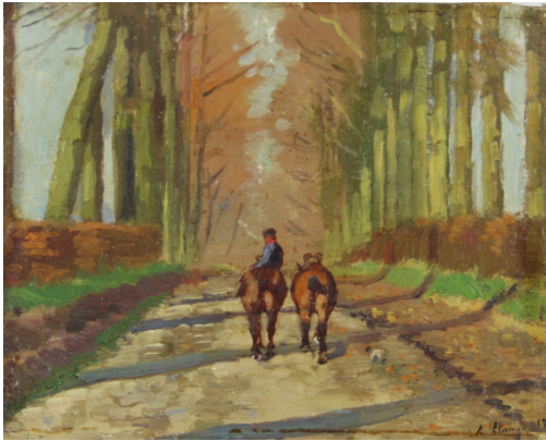
Tableau - "Retour À la ferme"